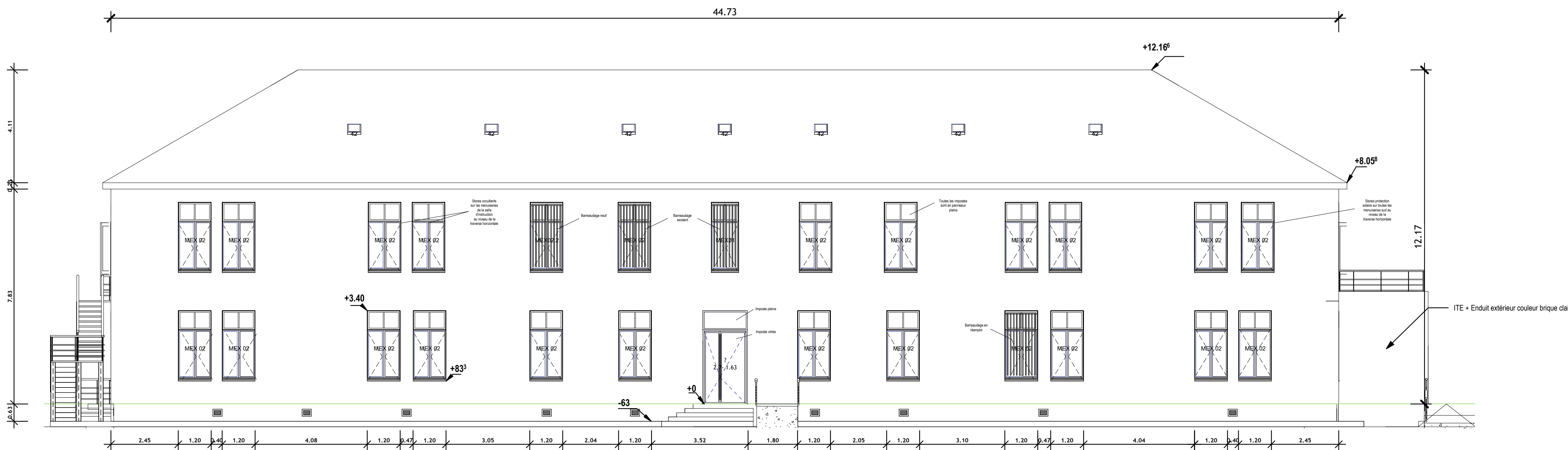
5 PRO Elévation Sud bat 056 Ech : 1 : 100