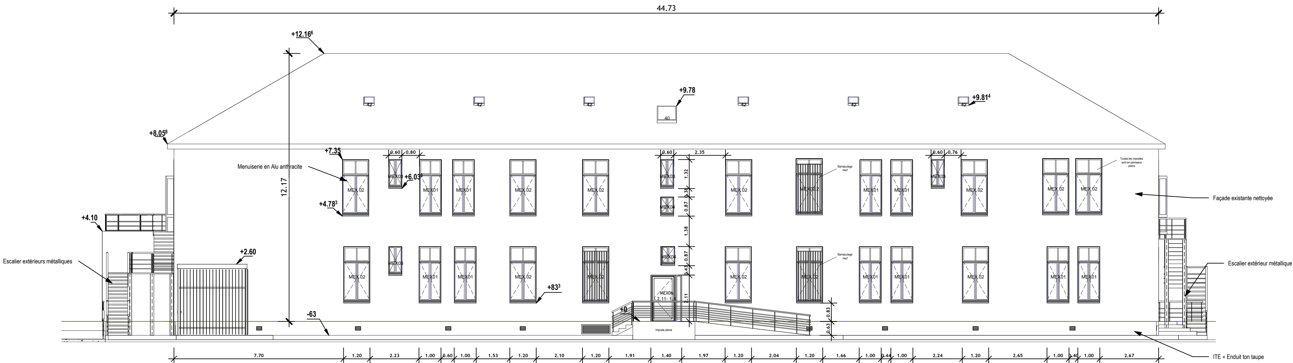
6 PRO Elévation Nord bat 056 Ech : 1 : 100